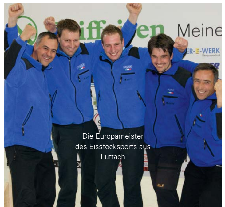
Die Europameister des Eisstocksports aus Luttach